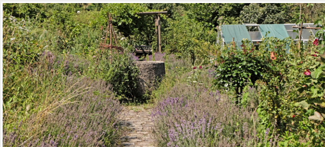
Naturgarten der vhs ökostation Stuttgart