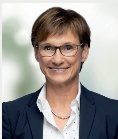
Sabine Kurtz MdL

Das Forum „Gärtnern macht Schule“ wird in diesem Jahr bereits zum 20. Mal angeboten. Dieses Jubiläum ist ein guter Anlass, sich auf Bewährtes zu besinnen und zugleich den Blick in die Zukunft zu richten und zu zeigen, wie wir Herausforderungen, vor denen unsere Gesellschaft steht, im Bereich der Schulgartenarbeit angehen können. Dazu zählen Maßnahmen zum Klimaschutz und die Anpassung an den Klimawandel ebenso wie der nachhaltige Umgang mit vorhandenen Ressourcen.